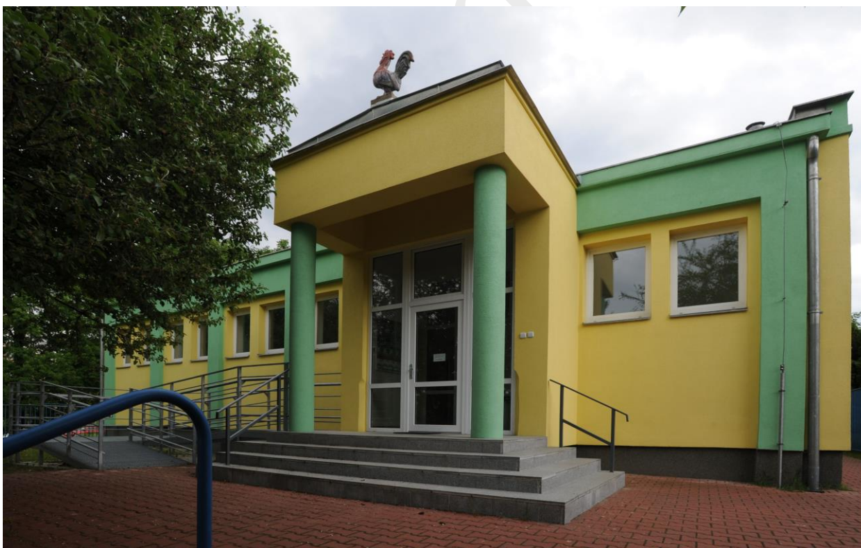
Brixiho 2, Praha 6 - Břevnov

bezbarierový vstup do objektu školy: Ano, ve škole v Brixiho ulici.