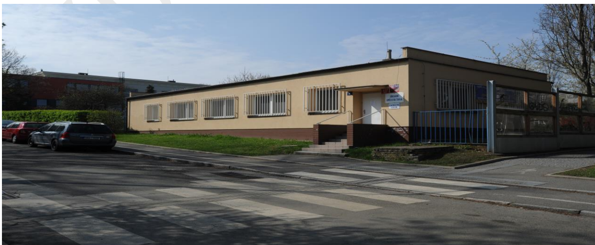
Morstadtova 3, Praha 6 - Hradčany

Závěrečný zahradní koncert ve škole Nad Alejí