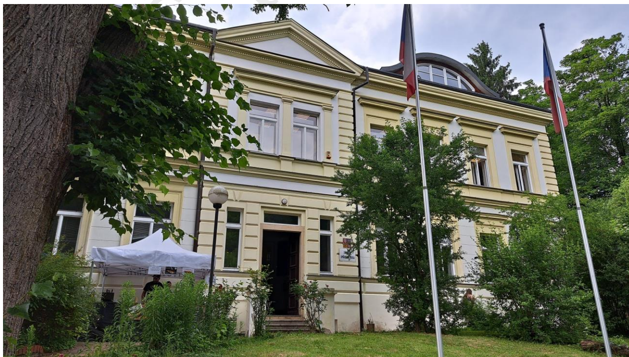
V Šáreckém údolí 38, Praha 6 - Dejvice